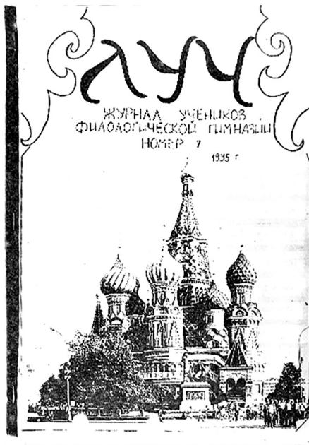
Слика 1. Насловна страна часописа Луч

За насловну страну свих бројева узет је један од најпознатијих симбола Русије – Храм Св. Василија Блаженог у Москви. Овим познатим избором чинило се као да редакција свима несвесно шаље позив за упознавање са руским светом. Техничка несавршеност часописа у супротности је са његовим садржајем. По примарном одређењу, Луч бисмо сврстали у књижев-но-уметничко хумористички часопис. То одражава заинтересованост наших ученика за науку и шалу. Из ученичких пера настале су прве објављене ризнице критичких осврта на језик и уметност. Уређивачки састав следио је концепцију часописа у свим бројевима. Прве странице су биле посвећене актуелним догађајима у школи, руско-српском пријатељству, успесима на такмичењу и садржају текућег броја који су увек отварале књижевне теме. Текстови су били инспирисани годишњицама рођења-смрти (годишњица Јесењиновог рођења и смрти, педесетогодишњица од смрти Марине Цветаеве, а критички осврти писани на основу дела Достојевског ( Унижен и оскорбљен ), Хармса ( Феномен Данила Хармса ), Гогоља ( В гостях у Пульхери-и Ивановны и Афанасия Ивановича ), Чехова ( Дядя Ваня ) или Мајаковс-