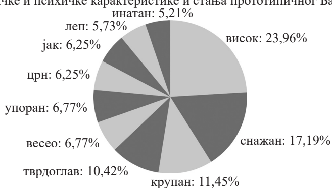
Прилог 1. Десет најфреквентнијих асоцијација на питање: „Како типичан Балканац изгледа психички и физички?“

Физичке и психичке карактеристике и стања прототипичног Балканца